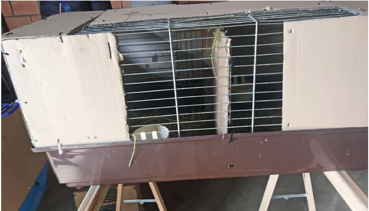
Hier wurde der Sichtschutz fix angebracht, was aus Sicht Tierschutz lobenswert war.