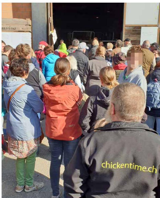
Vor der Halle gab es zu Veranstaltungsbeginn grossen Andrang.

Die Pferde wurden in der Mitte der Halle in Panelgehegen untergebracht, ebenso wie die Zwergziegen, das Schaf und das Pony. Esel gab es an diesem Ostermontag nicht, vor Ort war diesmal ein anderer Equidenhändler als beim letztjährigen Besuch des STS. Einige Gehege mit Kaninchen und Meerschweinchen waren ebenfalls in der Mitte der Halle. Entlang der Aussenwände befanden sich die restlichen Anbieterinnen und Anbieter mit diversen Kleintieren. Hinter den Tischen, auf welchen vor allem Kaninchen und Meerschweinchen platziert waren, befanden sich weitere Behälter (u. a. Kartonboxen mit Löchern), in denen weitere Tiere untergebracht waren. Einige Anbieterinnen und Anbieter betrieben ganz offensichtlich gewerbsmässigen Tierhandel. Der Anlass wurde auch genutzt, um den Nachwuchs der eigenen Hobbyzucht anzupreisen und zu verkaufen.