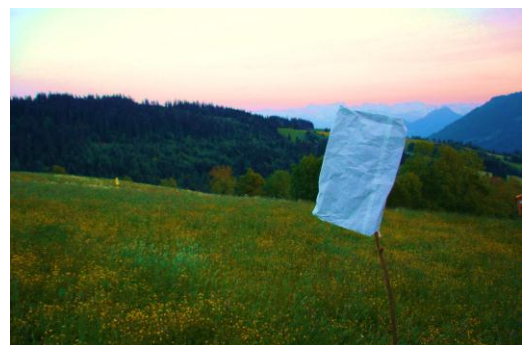
Auf einem Stock aufgesteckte Plastiktüte

Vor dem Aufstellen unbedingt die unmittelbare Umgebung um die Scheuche absuchen. Eine Rehgeiss würde sich eventuell nicht mehr trauen, ihr Kitz in der nächsten Nähe der Verblendung abzuholen!