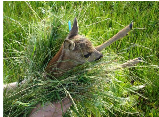
Gerettetes Rehkitz wird weggetragen.

Es gibt aber verschiedene Möglichkeiten und Massnahmen solche Mähverluste zu verhindern oder zu vermindern. Das Amt für Wald und Wild und der Zuger Kantonale Patentjägerverein setzen sich aktiv für die Rettung der Jungtiere ein.